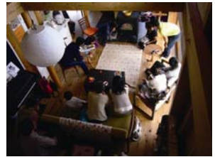
👉 前回の体験会のような