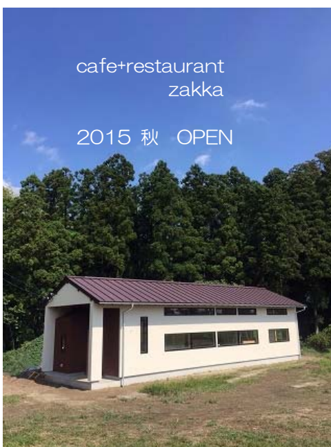
cafe+restaurant zakka 2015 秋 OPEN

この建物は住宅やアトリエなどにもそのまま使えるつくり になっています。 店舗はもちろん住宅の建築をお考えの方、 日常からはなれちょっとお茶を飲みに行ってみたいという方も 是非見に来て下さい。