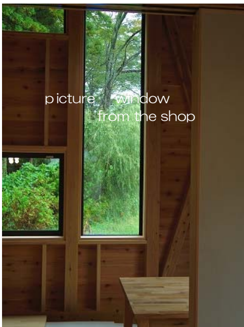
picture window from the shop

7月に構造内覧会をさせていただきました カフェレストランさんがいよいよOPENします！！ そのOPENに先駆けましてSEED設計室のお客様だけが 店内をごらんいただける内覧会です。 当日はゆっくりとお茶を飲みながら、お店の雰囲気を 楽しんでください。