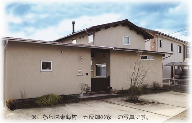
※こちらは東海村 五反畑の家 の写真です。

連休を含んだ、ちょっと長めの5日間おこないます。 皆さんにお会いするのを楽しみにお待ちしております。 是非お出かけくださいね！